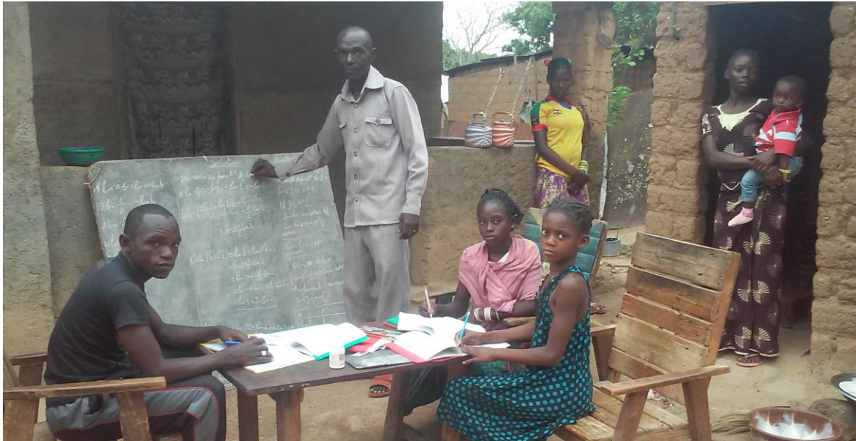
Francis familj lever nu ett lyckligt liv tillsammans och barnen drömmer om att ge tillbaka till sin pappa.