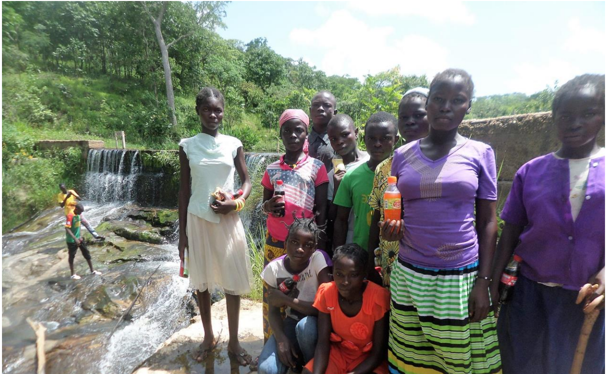
Några av de ungdomar som gjorde en utflykt till ett konstgjort vattenfall.