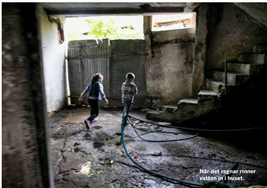
När det regnar rinner vatten in i huset.