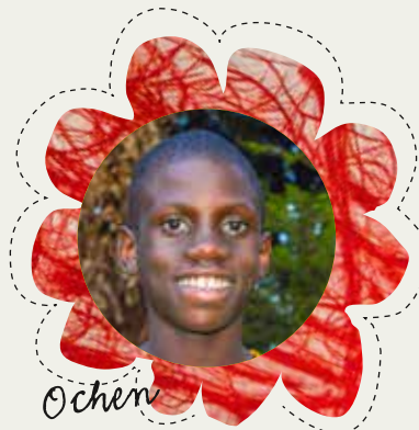
OCHEN, 13 ÅR, UGANDA – Jag vill bli en arkitekt så att jag kan bygga hus i Afrika i häftig och annorlunda design. Jag vill göra så att vår kontinent strålar.

Tack vare utbildning är 60% av de som deltagit i våra program idag självförsörjande individer.