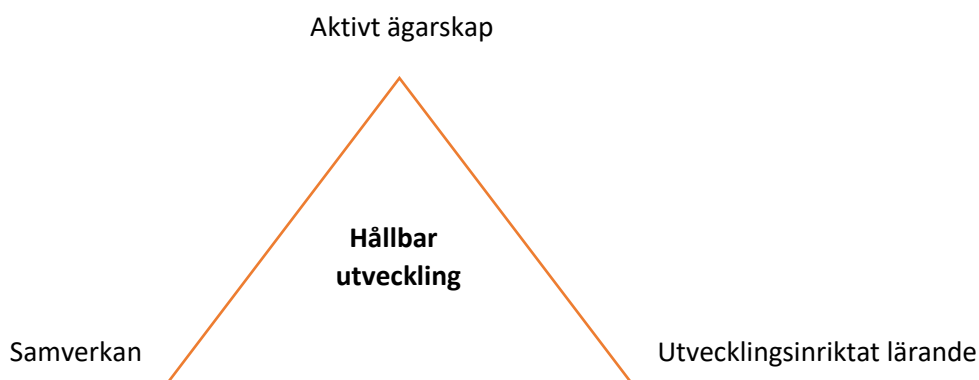
Figur 1. Mekanismer för långsiktig hållbarhet

Den lärande ansatsen är ofta avgörande för att kunna ta tillvara resultat. Insatser måste reflekteras över, processas, utmanas, störas. För att det ska bli ett lärande måste det skapas en lärande miljö på olika arenor, exempelvis i styrgruppen, bland projektpersonalen - att diskutera och reflektera över förväntningar, kontexter, villkor, kultur, förförståelse m.m.