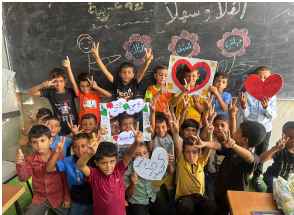
Genom tillfälliga lärocenter fick barn i Gaza tillgång till utbildning och utveckling.

Inom området Active Fatherhood har vi under året fokuserat på processer för kunskapsinhämtning och lärdomar från pågående implementering, och uppdaterat och förbättrat metodmaterialet, baserat på dessa lärdomar. Det här arbetet kommer att färdigställas under 2026.