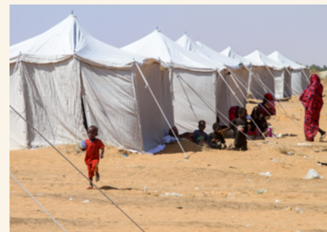
Familjer i ett läger i Sudan, kort efter att konflikten förvärrades i slutet av oktober. Kriget har tvingat miljontals på flykt och under året stöttade vi barn och familjer på tre platser i landet.

för att engagera donatorer och en strävan efter mer personlig kommunikation och diversifierade intäktströmmar. Totalt sett måste organisationer i Sverige och globalt anpassa sina strategier för att anpassa sig till ekonomiska tryck och givarmönster, samt arbeta proaktivt för att mobilisera stöd trots en komplex makroekonomisk omvärld.